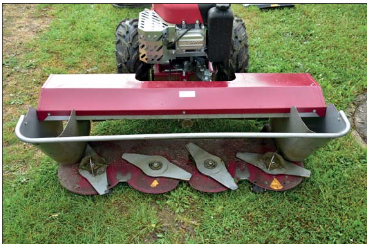
Čtyřdisková jednotka se šířkou záběru 125 cm je unikátním technickým řešením s konstrukční pečeti společnosti DAKR

„Někdo kombinuje i víc typů žacího ústrojí, protože každé má své pro i proti. Například mulčování je energeticky nejnáročnější a je potřeba k němu vybrat optimální pohonnou jednotku. Nelze jednoznačně říci, že některé sečení je nejlepší a jiné, třeba i vzhledem k nižší ceně, horší. Každé je na něco dobré a na něco jiného špatné. Záleží na konkrétních podmínkách.“