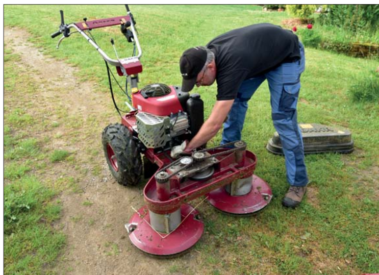
Výměna příslušenství k pohonné jednotce je jednoduchá. Nástavec RZS121 pohání klínový řemen, řetězy a ozubená kola